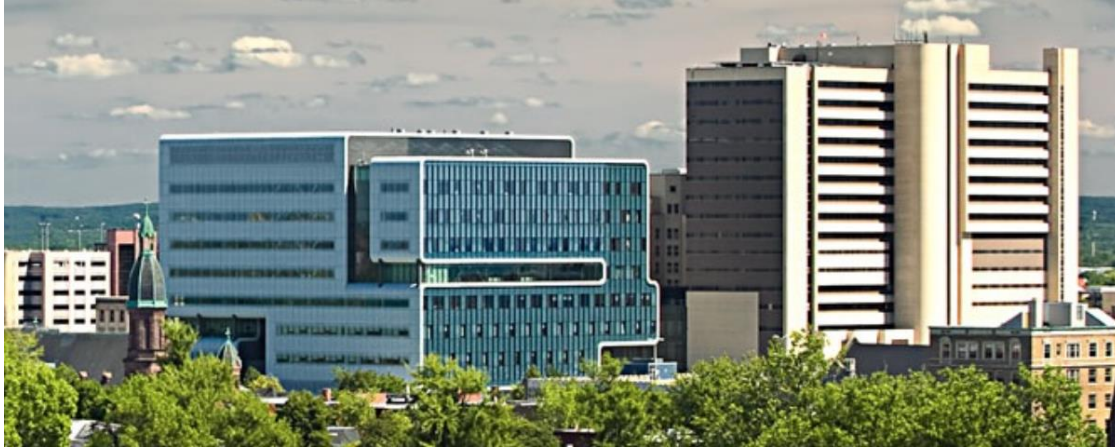
Buffalo General Hospital