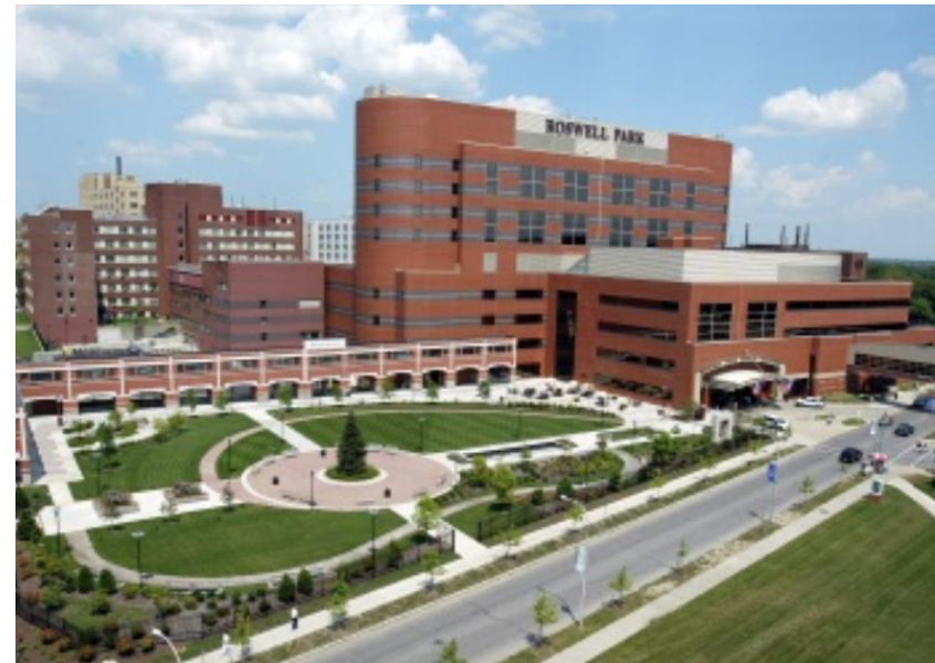
Roswell Park Cancer Institute